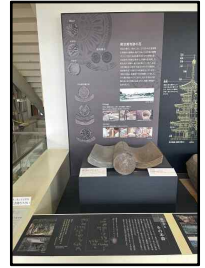
〈현지 대여유물 반납 전·후(1.15.)〉