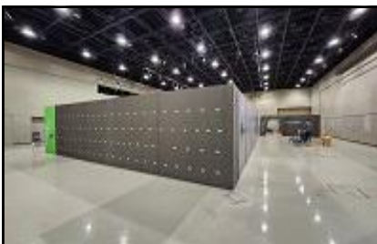
〈전시장 철거 모습(1.16.)〉