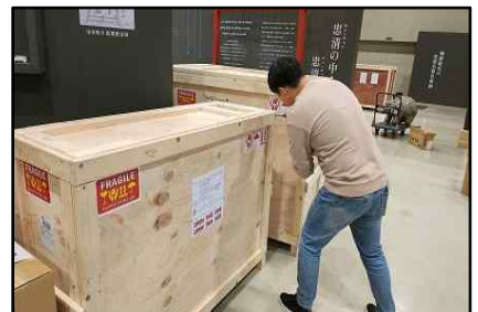
〈전시 유물 철거 및 포장(1.13~14.)〉