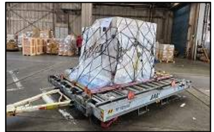
〈[참고] 반입유물 일본 나리타공항 입고(1.18.)〉