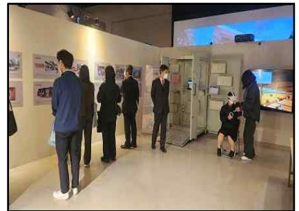
〈시즈오카 현지사 등 전시 안내(1.12.)〉