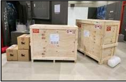
〈철거유물 운송사 인계(1.15.)〉