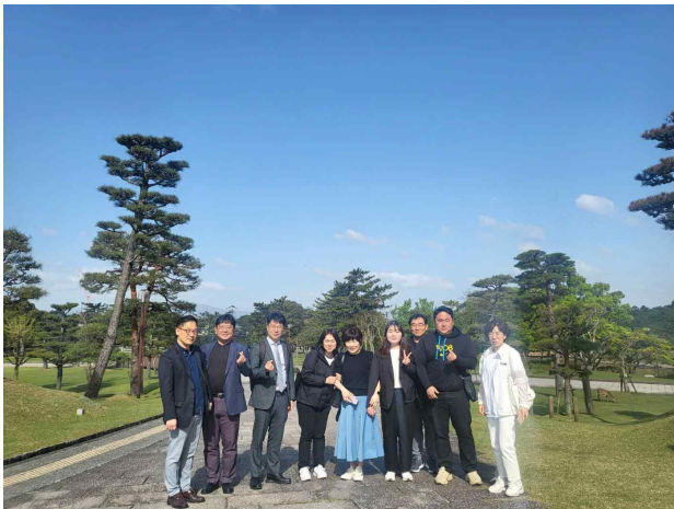
도다이지 공원 답사