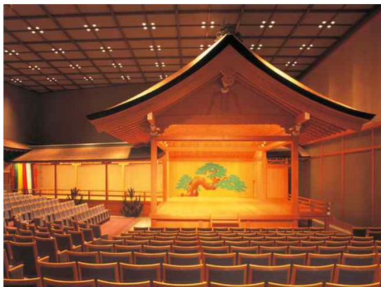
1층 회의장 내부