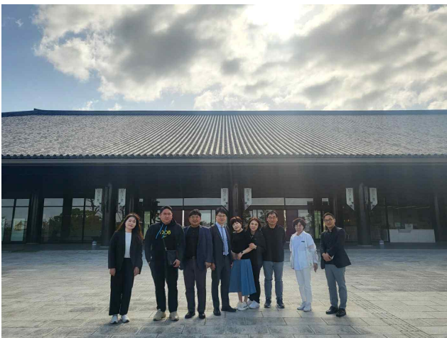
백제 포럼 장소(이라카) 앞