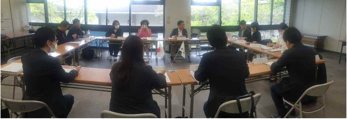
실무진 협의 모습(나라현청)