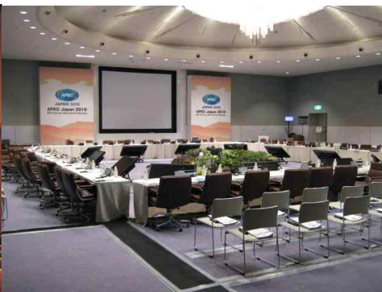
2층 리셉션 홀 내부