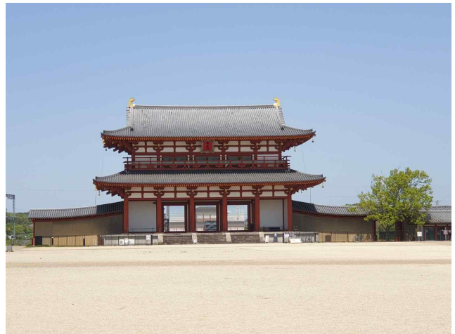
헤이조궁 정문 앞 광장